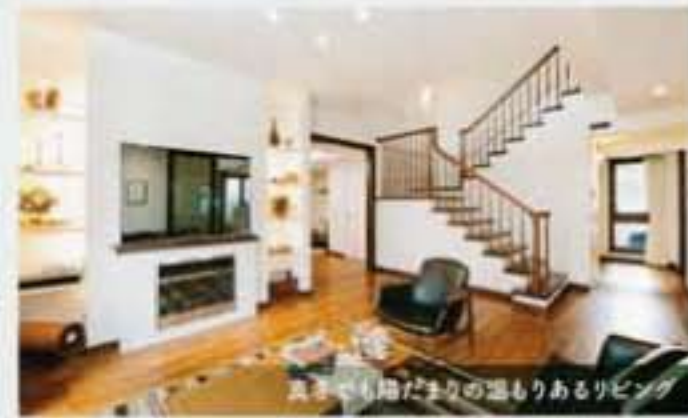
気取らずに心地よりの温もりあるリビング