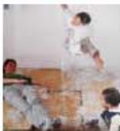
子どもは犬が大好き。シュレッダーしてあそんで嬉しそう(笑)